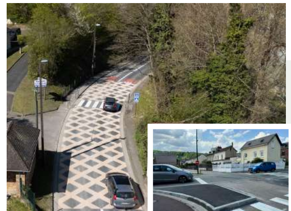
Le Val aux Dames

Mais aussi... implantation de butées pour sécuriser les places de stationnement situées rue Berrubé, derrière l'église Saint-Martin