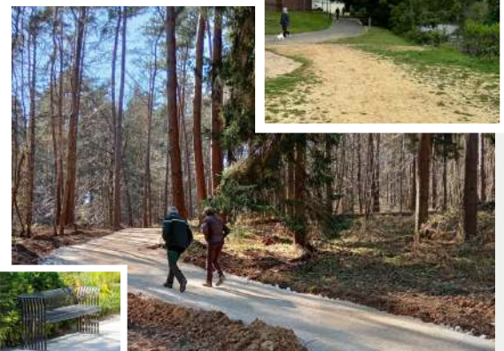
Chemin forestier et extension de la balade du Cailly

Mais aussi... installation progressive de plusieurs dizaines de bancs publics dans tous les lieux de détente de la ville (parcs, square, chemin forestier, etc.)