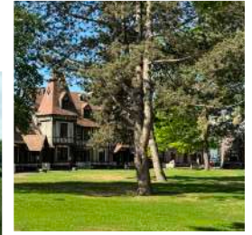
À droite, photographie du square Colette Privat. À gauche, le parc de l'Hôtel de Ville.