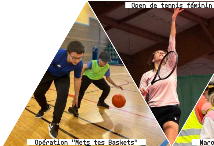
Opération "Mets tes Baskets"