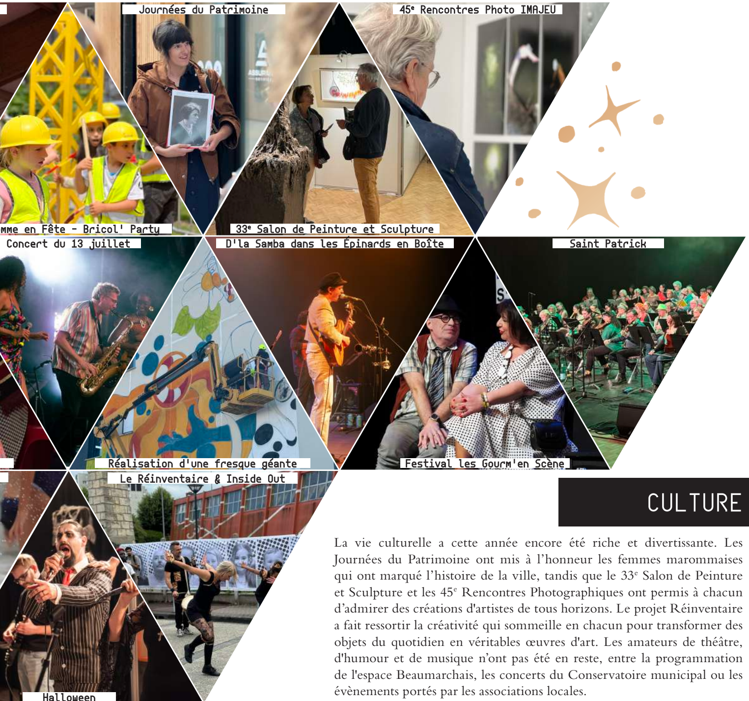
Journées du Patrimoine