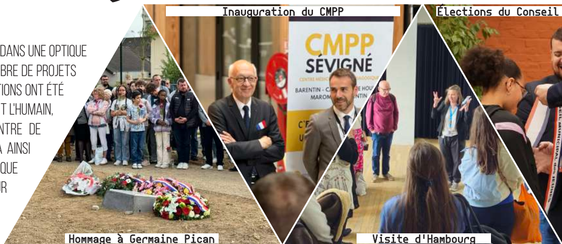
Inauguration du CMPP