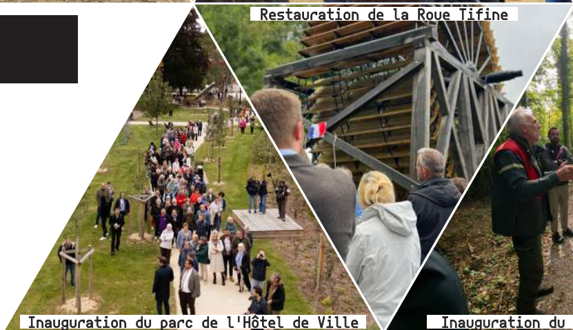
Inauguration du parc de l'Hôtel de Ville

Cette année a vu l'aboutissement d'un certain nombre de projets importants : la requalification du parc de l'Hôtel de Ville, la restauration de la roue Tifine ou encore la création du chemin forestier reliant le centre-ville à la ville haute. Les travaux d'agrandissement et de rénovation de la mairie-médiathèque ont également été engagés. La vie publique a elle aussi été animée entre le renouvellement du Conseil Municipal des Jeunes, l'adoption de l'Agenda 2030, la reprise du jumelage avec l'Allemagne ou même l'hommage rendu aux résistants de la ville et à l'emblématique Germaine Pican.