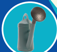
Objets en plastique