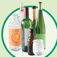
Les emballages en verre