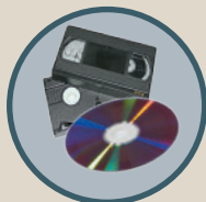
CD, DVD cassettes vidéo