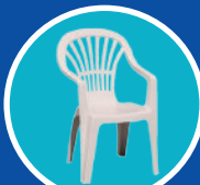
Mobilier de jardin